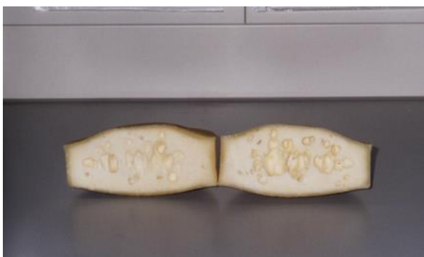
Slika 2. Kasno nadimanje sira – izgled pogreške.

Najvažniji nastali razgradni produkti su maslačna kiselina, ugljični dioksid (CO 2 ) i vodik (H 2 ). Kao posljedica maslačne fermentacije nastaju pogreške teksture i okusa. U težim slučajevima moguće su pukotine s velikim otvorima (slika 2) s vrlo lošim okusom i mirisom. Ova se pogreška javlja nakon nekoliko tjedana, pa čak i nekoliko mjeseci što označavamo kao kasno nadimanje. Dakle ova pogreška javit će se prvenstveno kod sireva koji zriju duže vrijeme. Clostridium tyrobutiricum je najvažnija bakterija uzročnik pogrešaka. Maslačno-kiselinska fermentacija ovisi o broju spora u mlijeku i njihovoj održivosti. Silaža loše kakvoće je najčešći izvor jer sadrži veliki broj spora koje preživljavaju uvjete u probavnom traktu i akumuliraju se u izmetu. Primjenom suvremenih higijenskih standarda nije moguće spriječiti kontaminaciju mlijeka sporama.